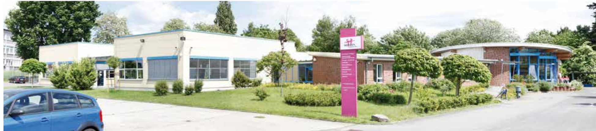
Hephata Werkstätten, Betriebsstätte Freiligrathstraße

Wo gibt es Markt? Welchen? Und: wie wirkt er?