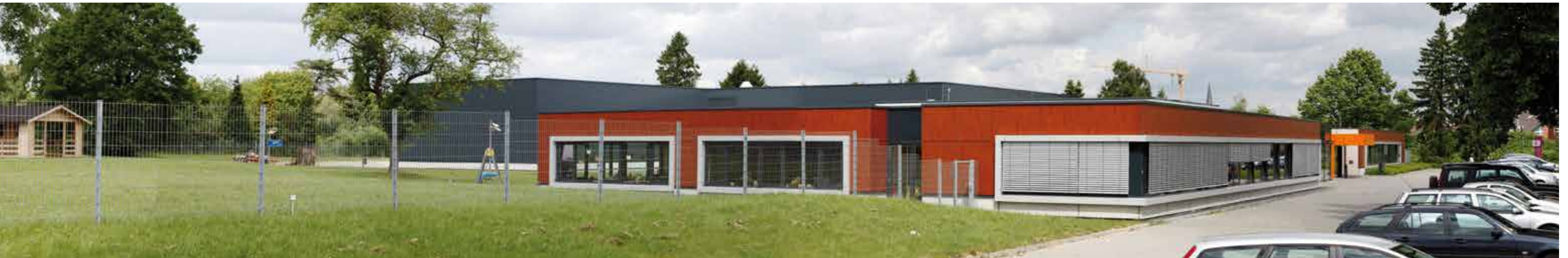
Hephata Werkstätten, Betriebsstätte Spielkaulenweg

LIEBE DEINEN NÄCHSTEN WIE DICH SELBST. Das ist zwar, insbesondere bei Nachbarn und Kollegen und Mitreisenden im Bahnabteil, manchmal nicht leicht, aber diese Idee gilt seit 2000 Jahren als gutes Leitbild für ein vernünftiges Leben. Und als vernünftiges Leitbild für ein gutes Leben.